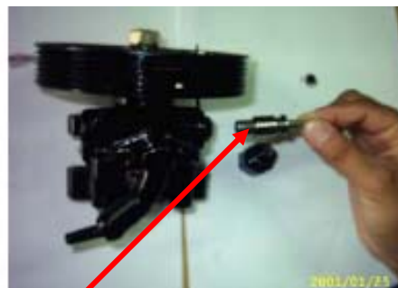
اسپول و فنر

1-4 مطابق تصاویر صفحه بعد توسط سرنگ مایع شوینده (الکل یا TCE) را با فشار از کانکتور عبور دهید در این شستشو از باز بودن سوراخ بغل کانکتور اطمینان حاصل نمایید سپس با فشار هوا کانکتور را کاملا تمیز نمایید .