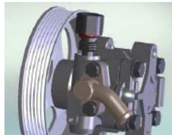
اورینگ کانکتور به شماره فنی 01715012

1-5- سرنگ حاوی مایع شوینده (الکل یا TCE) را با فشار از اسپول و سوراخ بغل اسپول عبور دهید. آلودگی های روی صافی را با شناور کردن اسپول داخل مایع شستشو و تکان دادن آن برطرف نمایید. توسط فشار باد اسپول را کاملاً تمیز نمایید.