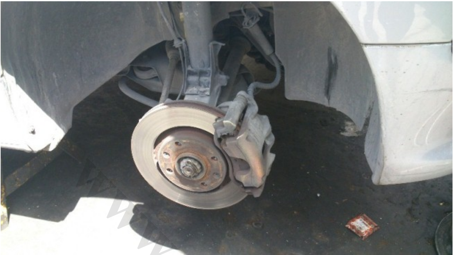
6-خار و نگهدارنده پیچ سر پلوس رو در میاریم و پیچ وسط (پیچ سر پلوس) رو با آچار بکس 35 باز میکنیم (برای تیپ 5)