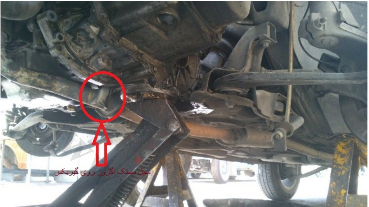
محل بستگ اگزوز روی گیربکس

10- چون میخوایم دسته موتور (درواقع دسته گیربکس) زیر باتری رو باز کنیم و گیربکس خودش رو ول میکنه , باید زیر گیربکس جک بزنیم و بعد باز کنیم