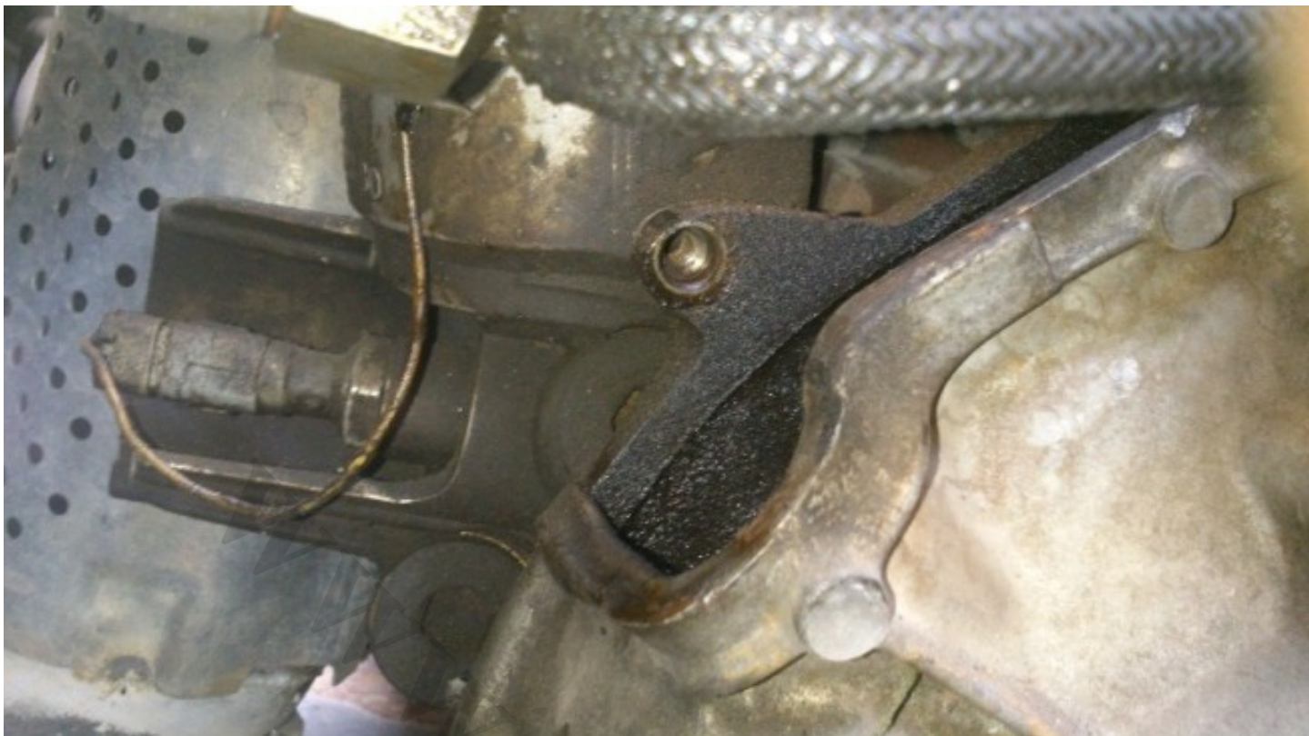
4- میل رابط ماهک ها رو هم از گیربکس جدا میکنیم (3تا هست ،2تا کوتاه و یکی بلند)