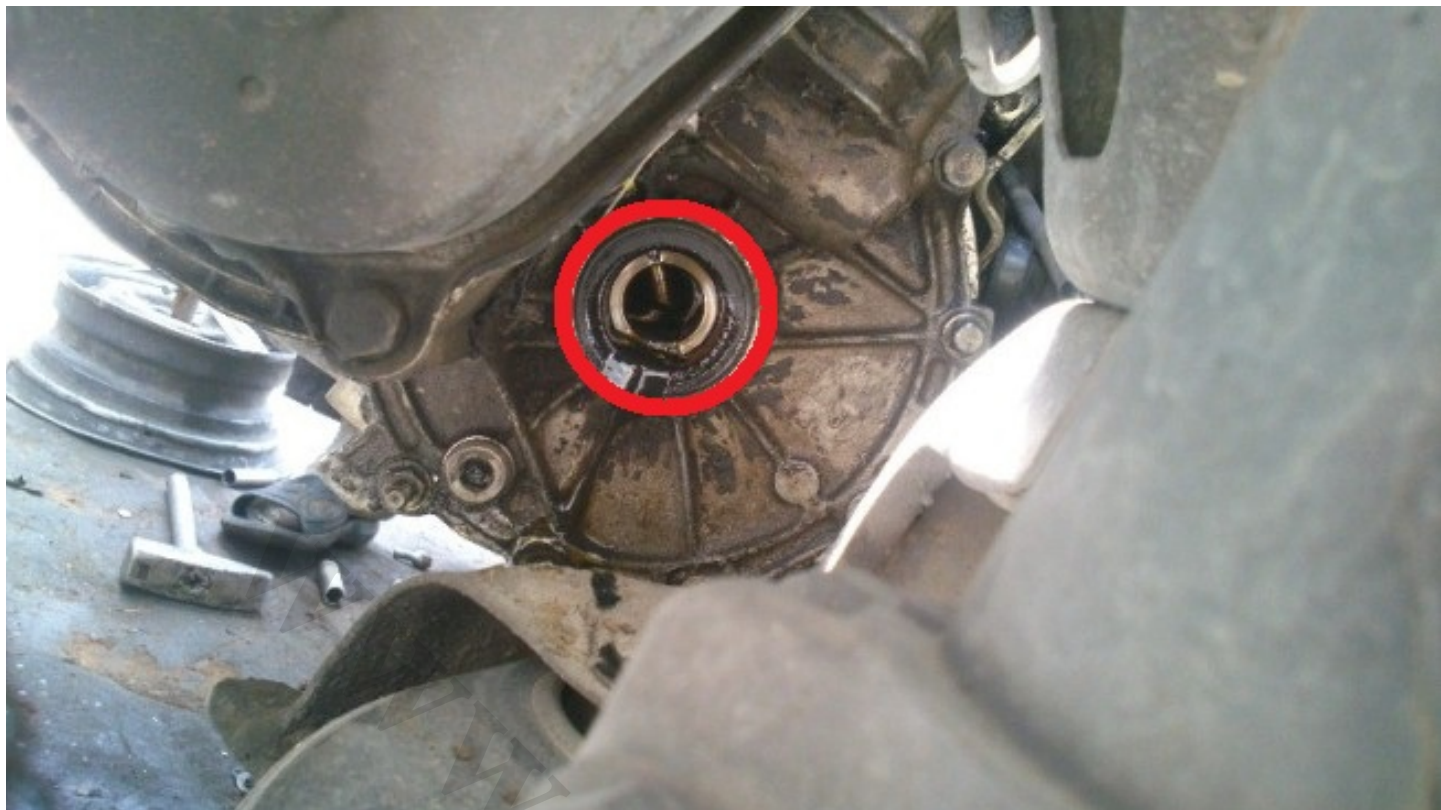
9- بازکردن پیچ دستک آگروز به گیربکس