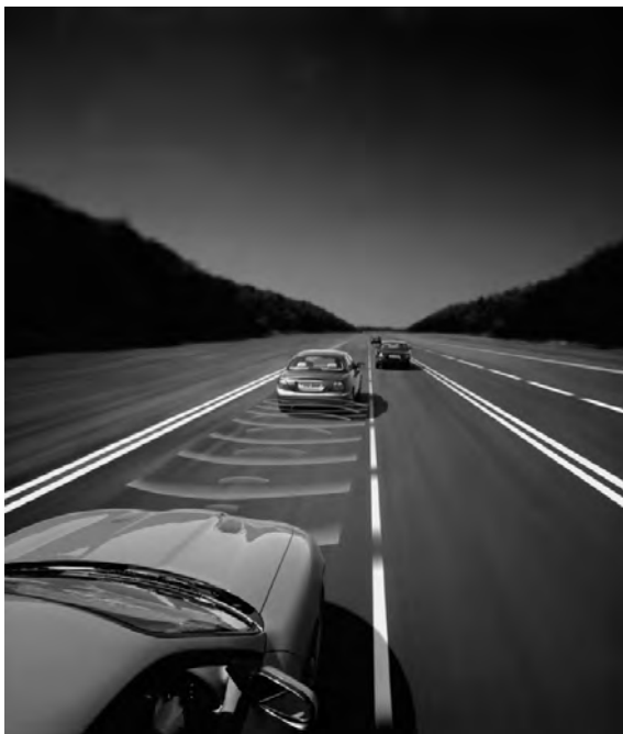
شکل (۲): خودروهای آینده توانایی حرکت بین مبدا و مقصد را بدون دخالت راننده خواهند داشت.

سیستم‌های ایمنی قابل اطمینان در خودرو، تحقیقات زیادی بر روی ترکیب اطلاعات سنسورهای مختلف در یک خودرو متمرکز شده است. هدف اصلی ایجاد خودروهایی هوشمند است که با توانمند نمودن آن‌ها به درک محیط اطراف خود بتوان هشدارها و یا محافظت‌هایی را نسبت به سرنشینان و همچنین دیگر عابرین در مسیر فراهم نمود. بسیاری از سیستم‌های ADAS و سیستم‌های ایمنی با بهره‌گیری از سنسورهای مختلف در ساختارهای مختلف در این مسیر حرکت می‌کنند. امروزه مشکل این سیستم‌ها دقت در درک محیط اطراف و تحلیل اطلاعات بدست آمده از سنسورها می‌باشد. این مشکل با روش‌های ترکیب اطلاعات سنسورهای مختلف در خودرو تا حد زیادی قابل حل است. روش‌های متنوعی در حوزه ترکیب اطلاعات وجود دارد که در آینده به مواردی از آن اشاره خواهیم کرد [۴]، [۵].