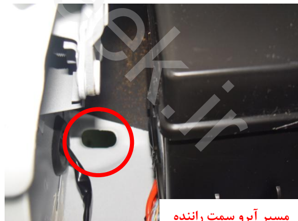
مسیر آبرو سمت راننده