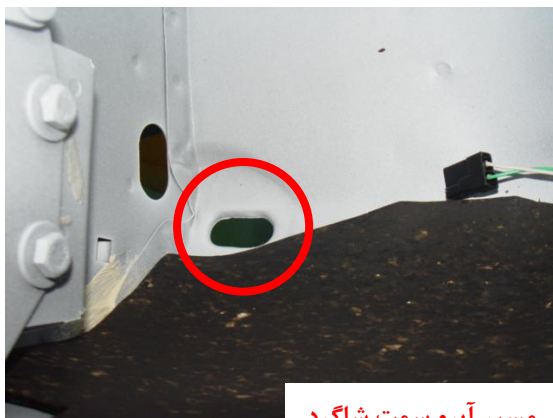
مسیر آبرو سمت شاگرد

۲-۱- مسیرهای آبرو جلو (سمت راننده و سمت شاگرد) کنترل گردد که عاری از ذرات خارجی بوده و مسدود نباشد.